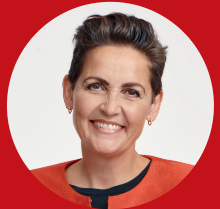
Pia Olsen Dyhr