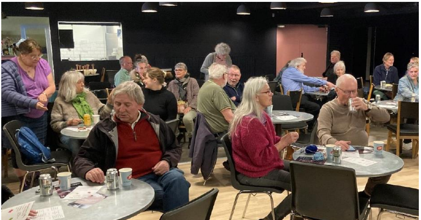
Et udsnit af deltagerne.