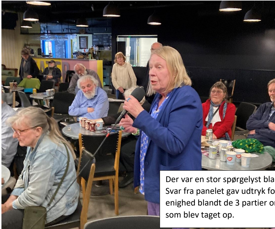
Der var en stor spørgelyst blandt deltagerne. Svar fra panelet gav udtryk for en rimelig enighed blandt de 3 partier om de forhold som blev taget op.