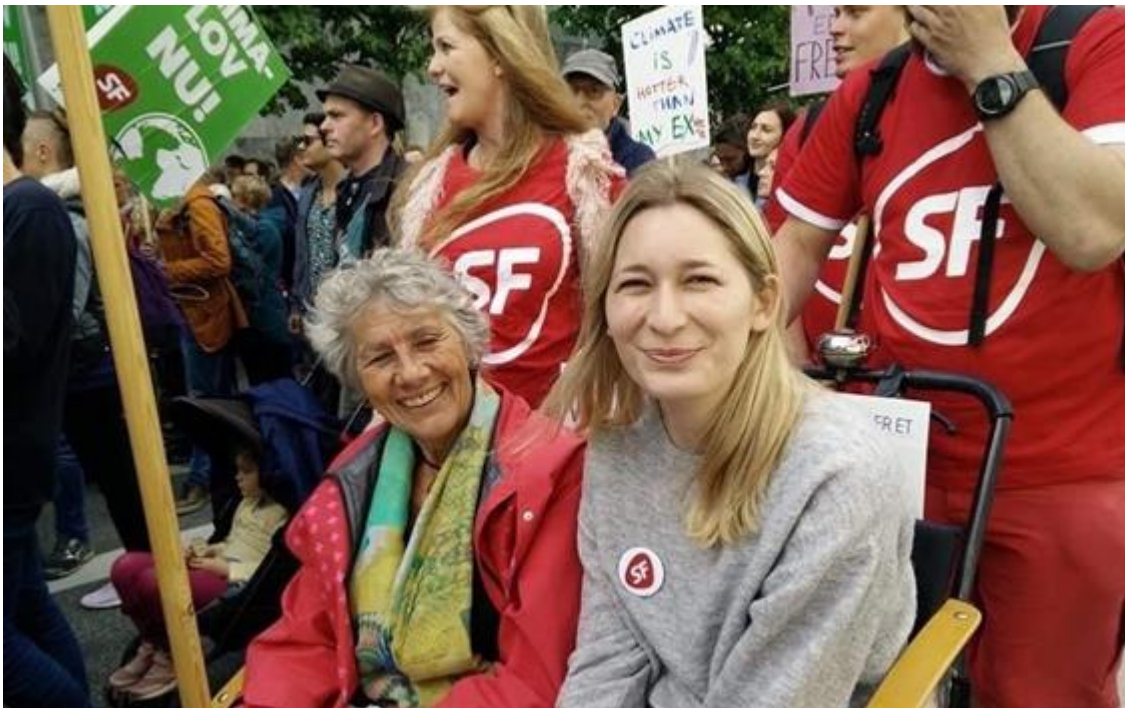
Nuværende medlemmer: Margrete Auken og Kira Marie Peter – Hansen.