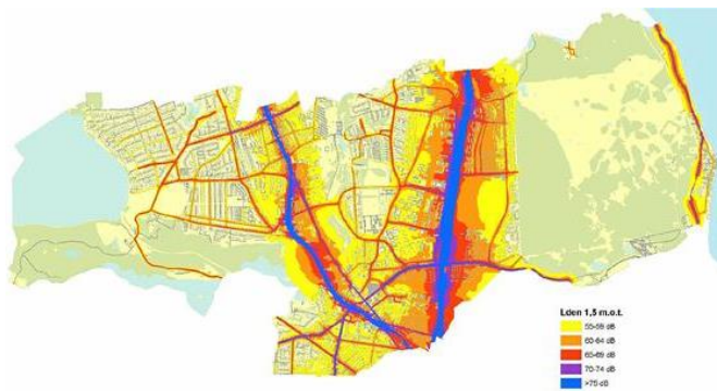
Figur 1 Resultat af EU støjkortlægning 2017. Årsmiddelværdi af støjniveauet L_{\text{eq}} fra kommune- og statsveje beregnet 1,5 m over terræn.

Der er for meget støjforurening i Lyngby-Taarbæk. Ikke kun oplever alt for mange borgere megen støj i deres hjem og på deres arbejdsplads, men støj er også en stor gene i flere af kommunens naturområder, som eksempelvis ved Lyngby Sø. Tæt på halvdelen af kommunens borgere er i det daglige udsat for støj i et omfang, der påvirker helbredet.