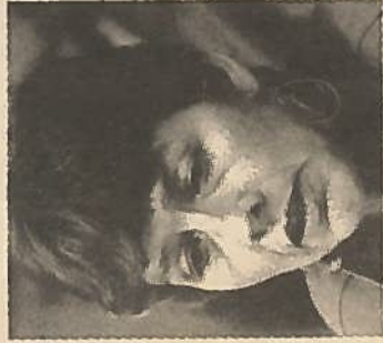
AF MARGRETE AUKEN

I dag skal Folketinget drøfte mulighederne for at mindske udslippet af drivhusgasser. Margrete Auken (SF) har sine tvivl om, hvorvidt der kommer noget ud af debatten, for er vort politiske system i det hele taget indstillet på at tage sådanne udfordringer som miljøtruslerne op, spørger hun.